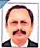
ડૉ. સુધીર પી. જ્યોતિ કોલેજ